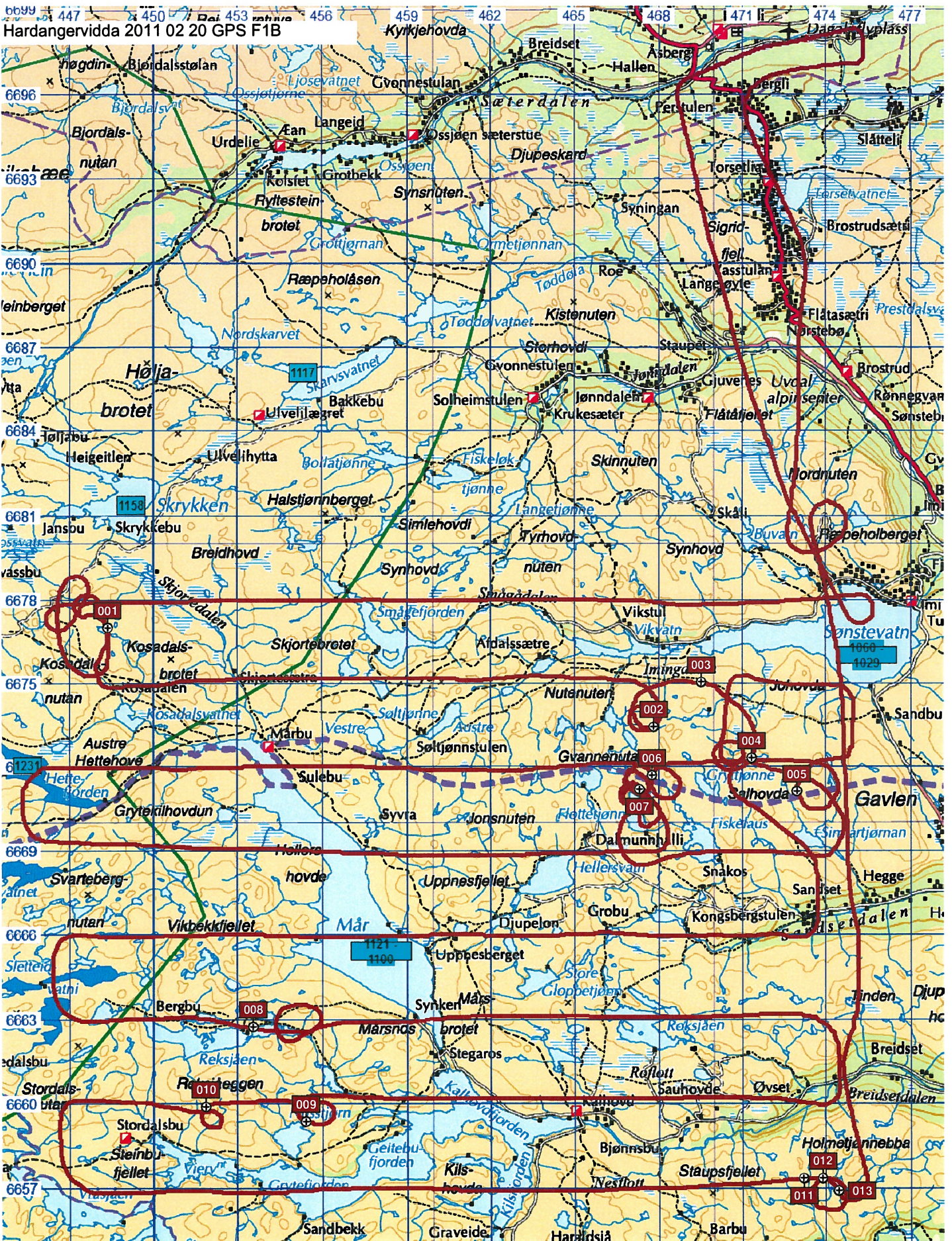
Hardangervidda villreinutval, begrenset flytelling (minimumstelling) 20.feb 2011. Fly 1, andre flyging (kontrolltelling).